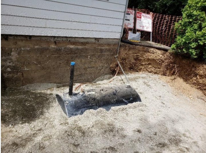
រូបថតសេចក្តីផ្តើមរបស់ Filco Company, Inc.

ឯកសារនេះផ្តល់ទិដ្ឋភាពនៃកម្មវិធីប្រាក់កម្ចី និងការផ្តល់ជំនួយប្រេងសម្រាប់កម្ពុជា និងបម្រើជាមគ្គុទេសក៍ការបកស្រាយដូច PLIA បំពេញច្បាប់កម្មវិធី។ មគ្គុទេសក៍នេះគឺជាយន្តការនានា និងទំនួលខុសត្រូវរបស់ PLIA និងម្ចាស់ និងប្រតិបត្តិករផ្ទុះប្រេង។ ការធ្វើបច្ចុប្បន្នភាពកម្មវិធីនិងច្បាប់នៅលើគេហទំព័ររបស់ PLIA នៅ www.plia.wa.gov . សូមទូរស័ព្ទ ឬអ៊ីមែលសម្រាប់ព័ត៌មានបន្ថែម ឬសំណួរអំពីមគ្គុទេសក៍នេះ។